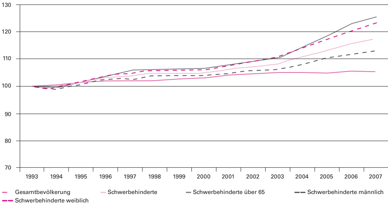
Darstellung 10.3: Vergleich der Entwicklung der Bevölkerungszahl sowie bestimmter Gruppen von Schwerbehinderten in BY 1993-2007 (Prozent; 1993=100)